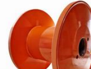
AĞIR İŞ MAKARASI