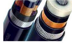
KABLOLAR İÇİN ZİRH