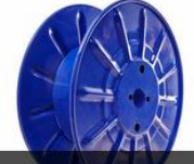
HAFİF PRES MAKARA