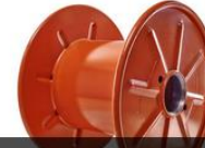
TEK CİDARLI PRES MAKARASI