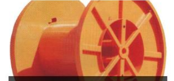
DÜZ FLANŞLI KABLO MAKARASI