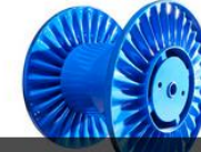
AKORDİYONLU KABLO MAKARASI