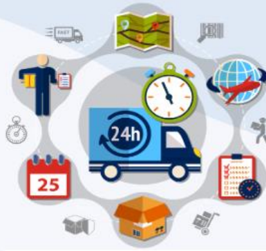
Sipariş Yönetim Programı