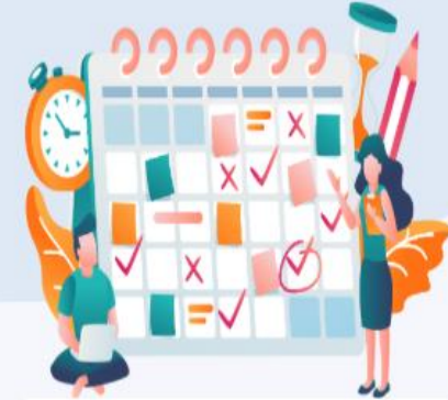
Randevu Yönetim Programı