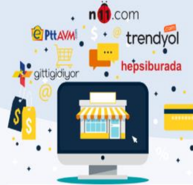
Pazar Yeri Yönetim Programı