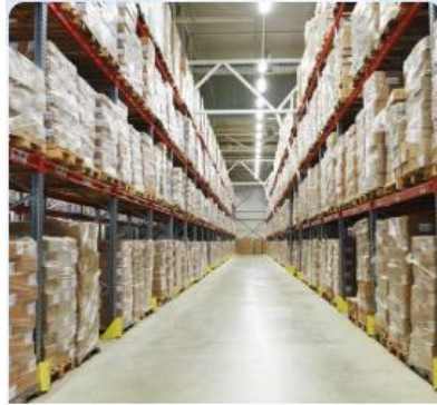
WMS - Raf Takip Programı

Depo Yönetim Sistemi (WMS), Saha Sipariş Uygulaması ve diğer yenilikçi çözümleri ile Türkiye'nin önde gelen bilgi teknolojileri, yazılım firmalarından biri olan şirket; Nebim V3 ERP entegrasyonları, Kargo entegrasyonları, E-Ticaret Entegrasyonları ve Pazaryeri Entegrasyonları çözümleri ile müşterilerine katma değerli çözümler sunmaktadır.